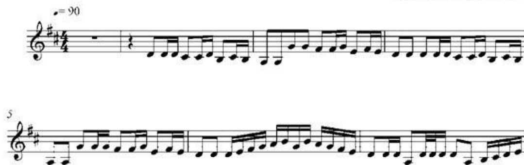
Notasi 1. Tema Melodi Lagu Begenjoh