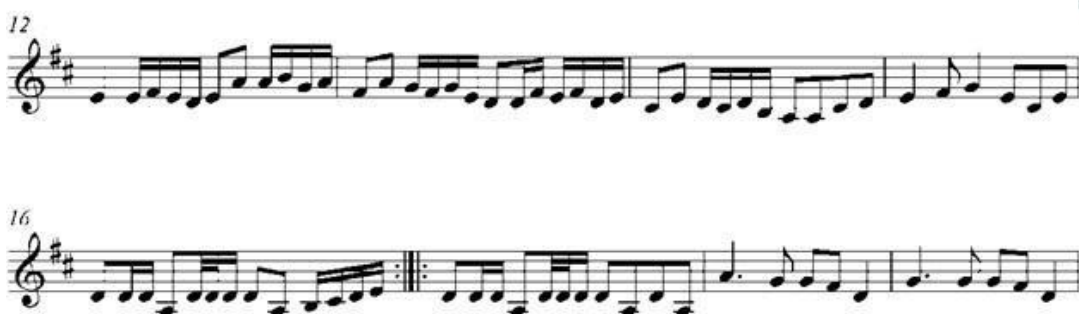
Notasi 2. Potongan Tema Melodi Lagu Begenjoh (Sumber Oleh : Transkripsi Asril Gunawan, 2018)