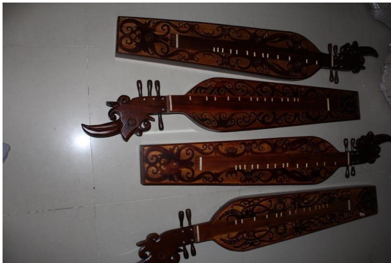
Gambar 1. Alat musik Sape Dayak Kenyah